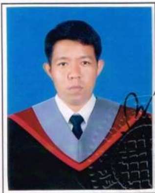
หัวหน้างานทะเบียนนิสิต เป็นผู้ลงนามรับรองรูป