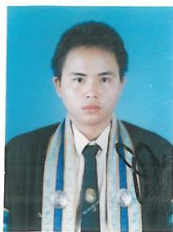
หัวหน้าฝ่ายทะเบียนและวัดผล

ให้ไว้ ณ วันที่ 21 เดือน พฤษภาคม พุทธศักราช 2547